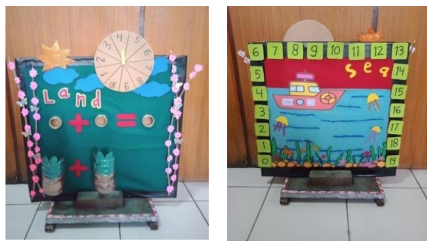
Gambar 2. Tampilan produk media Sea and Land

Media Sea and Land memiliki 2 sisi yaitu: (1) sisi " Sea " yang akan bertugas mengembangkan kemampuan berhitung, dalam hal ini berhitung yang akan dikembangkan adalah kemampuan pengurangan dan (2) sisi " Land " yang akan bertugas mengembangkan kemampuan berhitung, dalam hal adalah kemampuan berhitung yang akan dikembangkan adalah kemampuan penjumlahan.