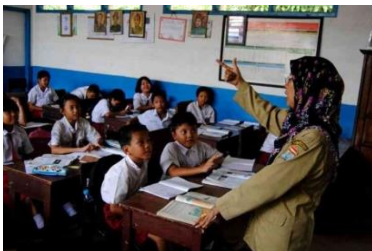
Gambar 1.1 Guru menjelaskan pemahaman tentang buku saku

Adapun salah satu hasil studi pendahuluan yaitu beberapa kekurangan pada buku yang digunakan di SD Negeri Lamreh yaitu 1). Buku tersebut terlalu kaku dan tidak menarik minat siswa karena dengan isinya yang penuh dengan tulisan sehingga siswa kurang tertarik dalam belajar membaca. 2).Tampilan pada buku yang kurang warna dan hanya terdapat sedikit gambar menyebabkan menurun nya minat membaca. 3).Ukuran buku terlalu besar dan tidak diperuntukkan peserta didik membawa pulang sehingga peserta didik tidak ada bahan belajar dirumah. 4).Buku yang tebal menyebabkan siswa jenuh dalam belajar membaca. 5). Buku tersebut kurang cocok dengan karakteristik siswa dan kemampuan siswa dalam membaca sehingga perlu adanya pengembangan yang dilakukan. Kelebihan pada buku yang digunakan di SD menurut peneliti adalah 1). Buku yang digunakan memuat beberapa pelajaran dan lebih lengkap. 2). Buku pembelajaran berisikan informasi tentang kehidupan sehari-hari sehingga lebih mudah dimengerti. (Kasmini, 2023).