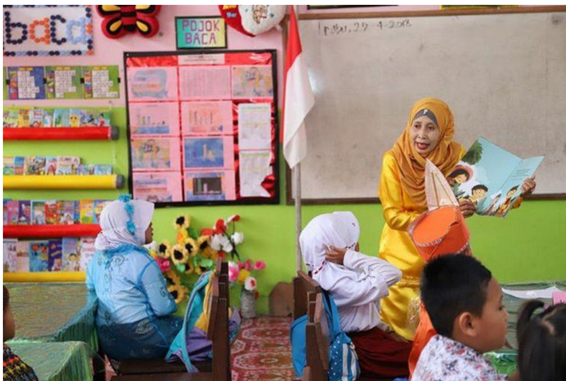
Gambar: Literasi Membaca Dan Mengamati