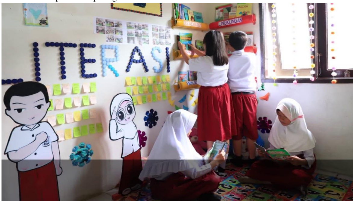
Gambar: Literasi Pembuatan Mading

Pelaksanaan dapat dilihat pada gambar berikut: